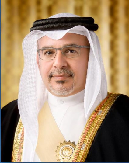
صاحب السمو الملكي الأمير سلمان بن حمد آل خليفة ولي العهد نائب القائد الأعلى رئيس مجلس الوزراء