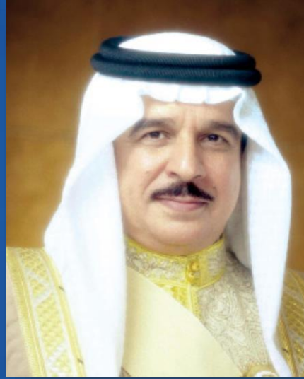
صاحب الجلالة الملك حمد بن عيسى آل خليفة ملك البلاد المعظم